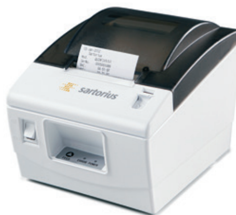
Plug & Play Standarddrucker YPD40

Nur zwei große, leicht zu bedienende Stellfüße und eine sehr gut ablesbare Libelle an der Vorderseite erleichtern das Nivellieren der Waage und tragen zu sicheren und wiederholbaren Wägebewerten bei.